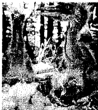
Warten auf den Herrn der Ringe.