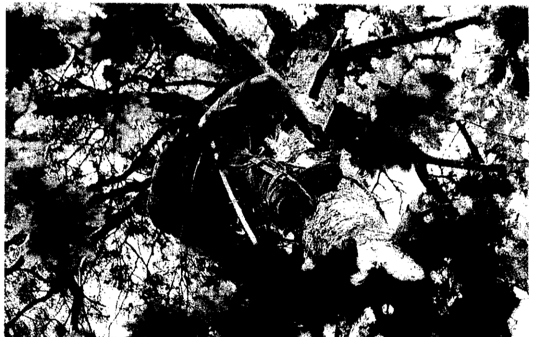
Stephan Binder erklimmt die Kiefer. Zwölf Küken seilt er im Stoffbeutel zum Beringen ab.