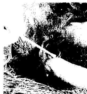
Untersuchung auf Vogelgrippe.