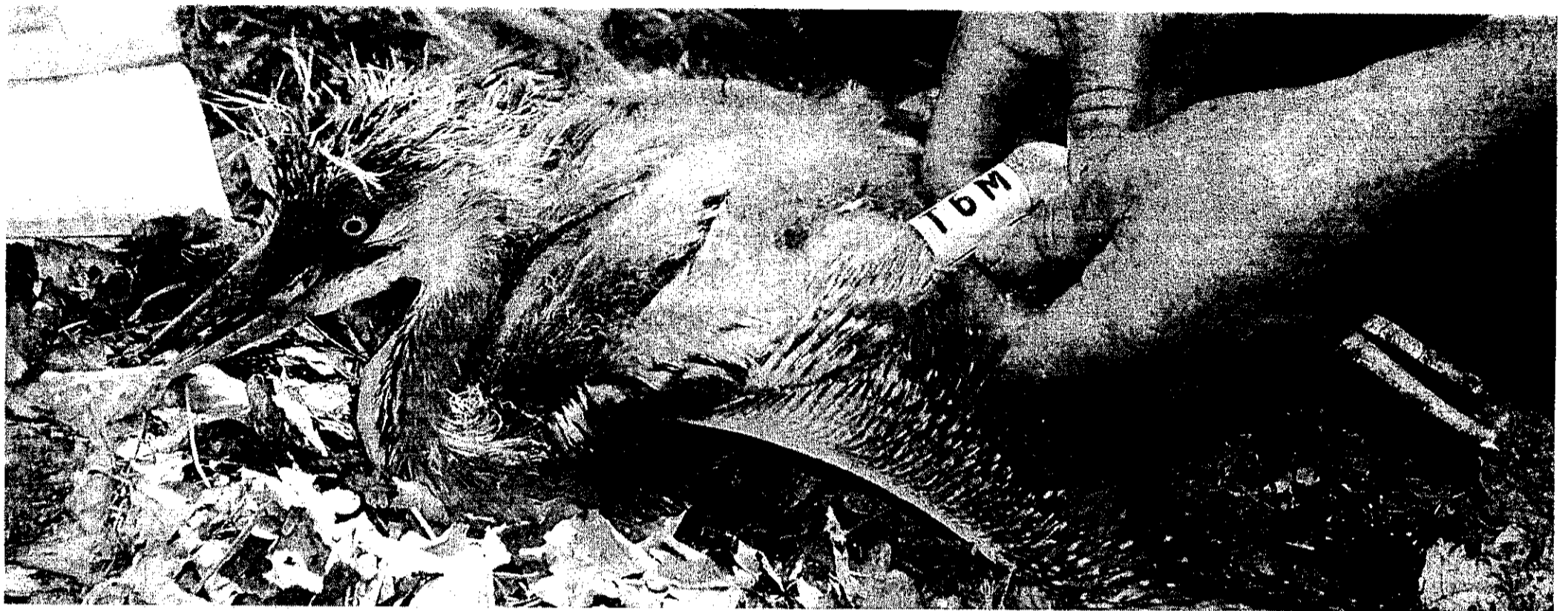
Sind die Küken groß genug, erhalten sie zusätzlich einen Farbring, der sich auch mit dem Fernrohr ablesen lässt. „T6M“ kennzeichnet Heino Kaspers tausendstes Graureiherküken seiner Beringerlaufbahn.